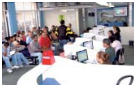
Vagas abertas: agências já começam a recrutar candidatas

Para fazer bonito na ocasião, as produtoras de chocolate começam a intensificar as contratações temporárias para estes próximos dois meses, seja para