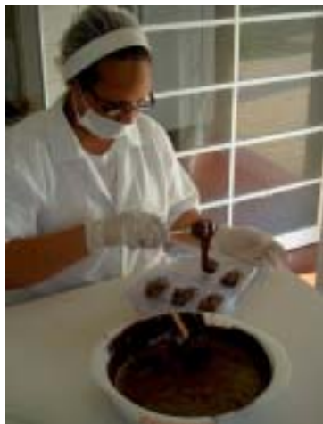
Linha de produção: mais de 500 vagas pelo país