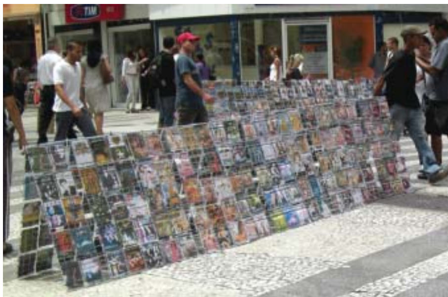
Piratas do asfalto: no centro da capital, predominância da ilegalidade

país contra esse tipo de crime. Desde 2004, já foram realizadas 64 operações policiais contra a pirataria e mais de 10 mil pessoas foram presas pela prática desse tipo de crime. Segundo números divulgados pelo Ministério da Justiça, são apreendidos cerca de 1,5 bilhões de itens por ano no país.