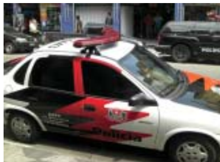
Policiação nas ruas: reforço à vista

De acordo com Ortega, até meados de novembro de 2009, foram 58 milhões de produtos apreendidos e dois milhões de empregos deixaram de ser gerados por conta da pirataria. Ele afirmou ainda em declaração à imprensa que “a pirataria envolve esquemas do crime organizado, o que fomenta vários outros crimes, muitas vezes utilizando-se da oportunidade da venda de produtos piratas, de contrabando ou descaminho e produtos de roubo de carga”.